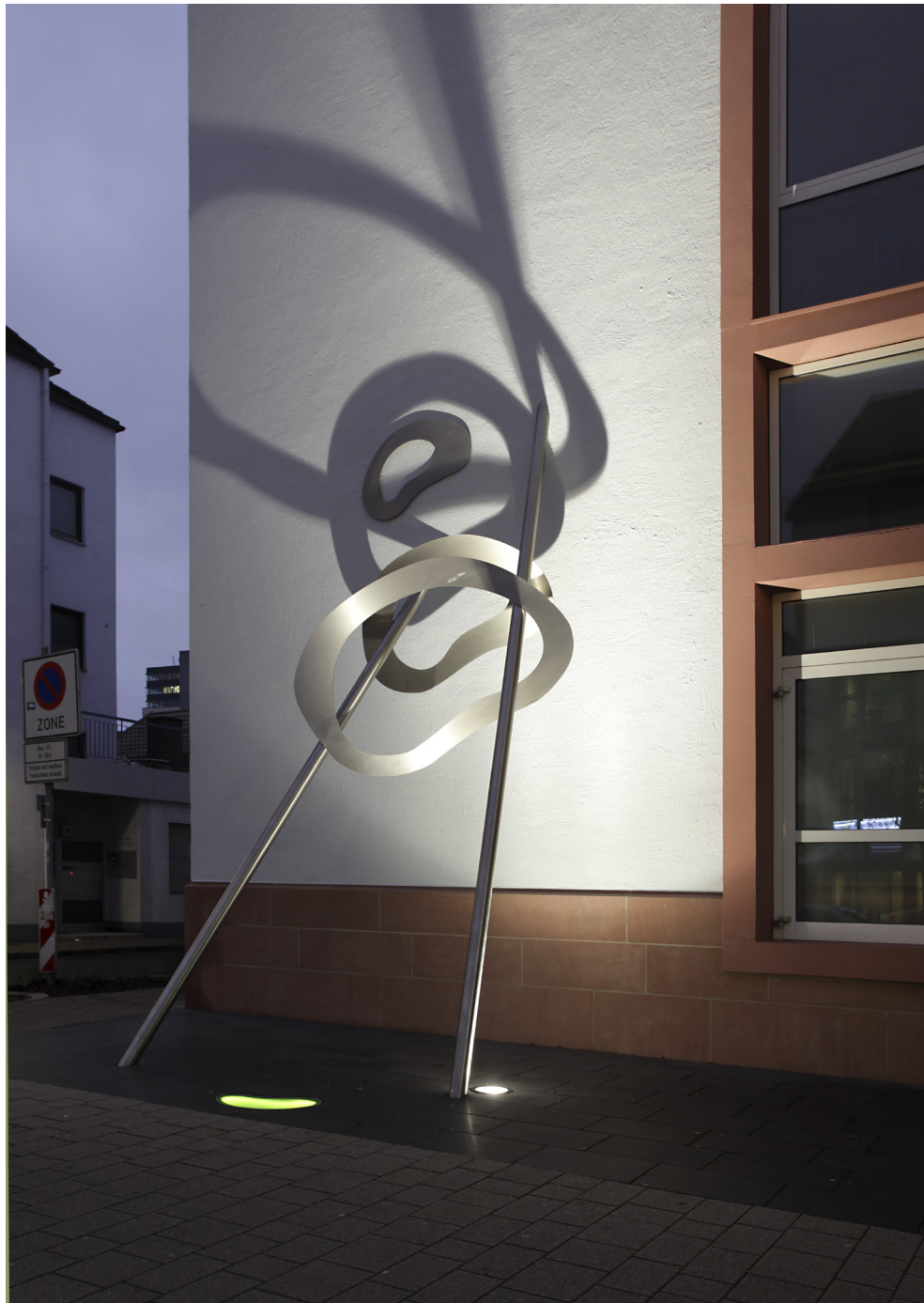
Finanzamt Kaiserslautern, Erweiterung des Dienstgebäudes in Passivhausbauweise