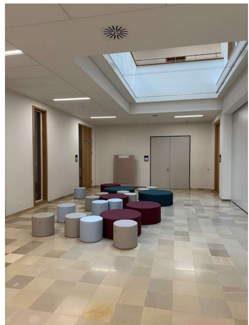
Atrium im Erdgeschoss