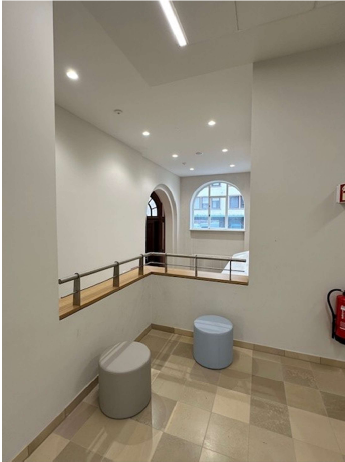
Durchblick vom Atrium