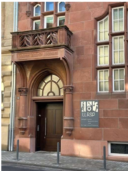
Haupteingang von der Alleestraße