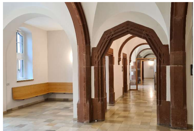
Umfeld Blickachse Neubau – historischer Bestand